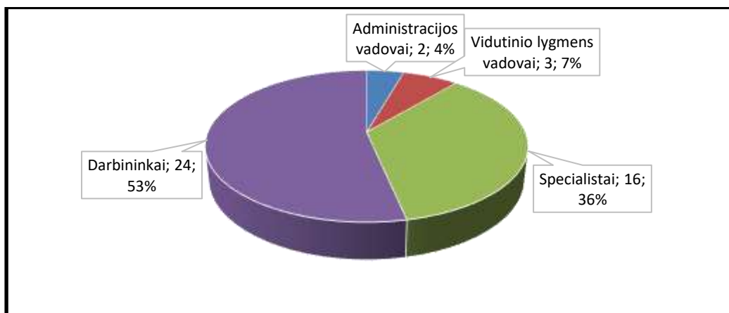
2 pav. UAB „Šiaulių gatvių apšvietimas“ darbuotojų struktūra